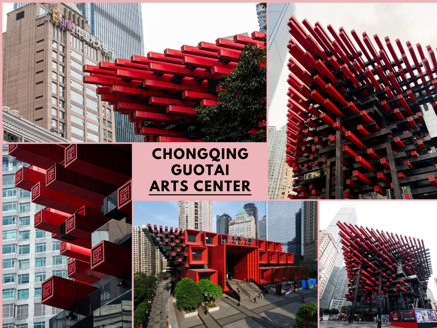
CHONGQING GUOTAI ARTS CENTER

จากนั้นนำท่านสู่ ตึกตะเกียบ (Chongqing Guotai Arts Center) แลนด์มาร์กดีไซน์ล้ำสมัย เป็นสิ่งก่อสร้างอันมีเอกลักษณ์ อาคารนี้ถูกออกแบบให้มีรูปร่างคล้ายกอง “ตะเกียบยักษ์” สีดำ และแดงที่วางซ้อนกันเป็นชั้น ๆ สร้างความประทับใจให้กับผู้พบเห็นตั้งแต่แรกเห็น นอกจากนี้จะเป็นสัญลักษณ์ที่โดดเด่นแล้ว ยังเป็นศูนย์รวมงานศิลปะที่สำคัญ มีการจัดแสดงนิทรรศการศิลปะหลากหลายประเภท ทั้งภาพวาด ประติมากรรม และการแสดงต่าง ๆ สะท้อนถึงความคิดสร้างสรรค์ และการผสมผสานระหว่างวัฒนธรรมจีนดั้งเดิมกับความทันสมัยได้อย่างลงตัว ตึกตะเกียบจึงเป็นสัญลักษณ์แห่งความภาคภูมิใจ ความเป็นเอกลักษณ์ของเมืองฉงชิ่งที่นำมาเยือน และชื่นชมอย่างยิ่ง