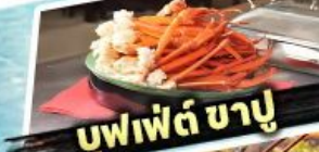
บุฟเฟต์ บาปู