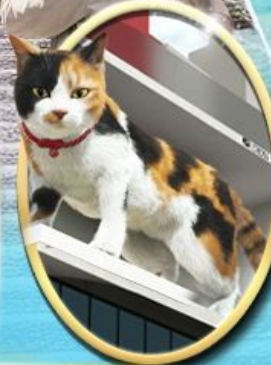
ซัปโปง ชินจุกุ