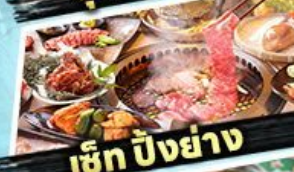
เซ็ท ปิงย่าง