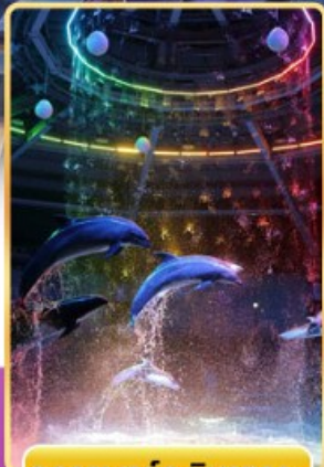
อควาพาร์ค ซินางาวะ