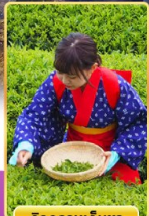
กิจกรรมเก็บชา