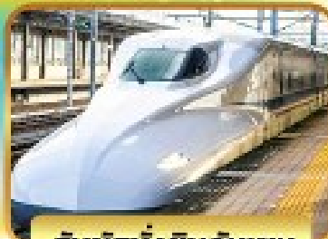
สัมผัสนั่งชินกันเซน