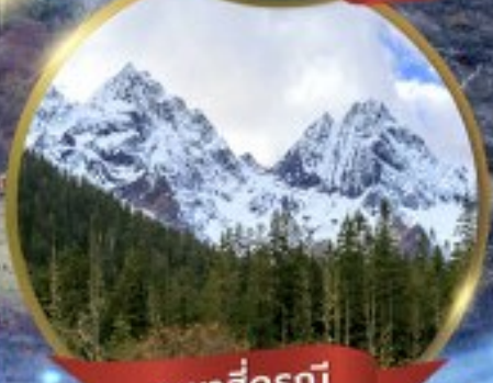
ภูเขาสัตว์ดุ