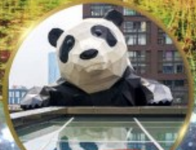
แพนด้ายักษ์

มหัศจรรย์ความงาม อุทยานจิวจ้ายโกว (รวมรถเหมาเที่ยวอุทยานเต็มวัน) ชมอุทยานหวงหลง (รวมกระเช้า) • สัตว์ดุ • อุทยานของเขี้ยวโกว (รวมรถอุทยาน) เมืองเก่าชงพาน • ถนนคนเดินจิมหลี่ + ไถ่ตู้หลี่ • ชมแพนด้ายักษ์ป็นตึก