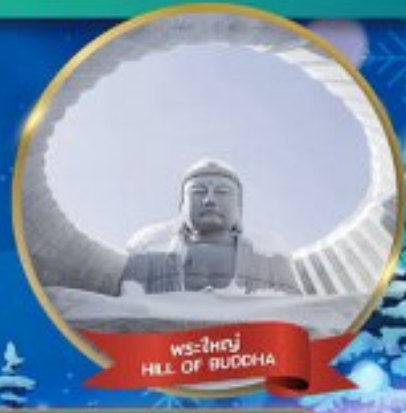
พระใหญ่ HILL OF BUDDHA

พักอาซาฮิคาว่า 1 คืน - โอดารุ 1 คืน - ซัปโปโร 2 คืน (ติดย่านช้อปปิ้ง)