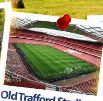
Old Trafford Stadium