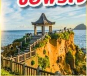
เกาะเหอผิง

พักย่านซีเหมินติง 2 คืน ขอพรเจ้าแม่กวนอิมพันมือ