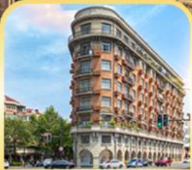
อาคารอู่คัง