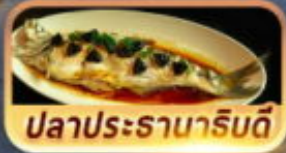
ปลาประธารานาโรบตี