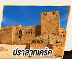
ปราสาทเคิร์ค