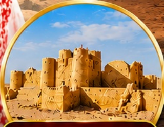
กลุ่มปราสาททะเลทราย (Desert Castles)