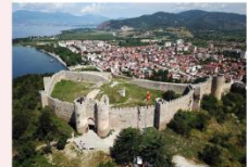
St. John at Kaneo Church ป้อมปราการซามูเอล

** พักที่ Hotel Holiday Inn 4* หรือเทียบเท่า **