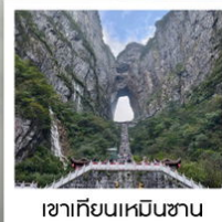
เขากียนเหมินซาน

ฉลองเที่ยวบินปฐมฤกษ์ เก็บครบทุกไฮไลต์!! วันที่ 10 พฤษภาคม 2569 กรุงเทพฯ - อางซา (จางเจียเจี๋ย)