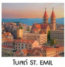
โบสถ์ ST. EMIL