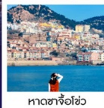
หาดซาจื่อฮั่ว