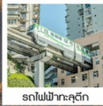
รถไฟฟ้าคุตัก