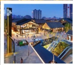
ถนนคนเดินไต้กู่หลี่