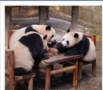
สวนสัตว์ฉางชิ่ง

สวนสัตว์ฉางชิ่ง • เมืองโบราณซือปาเก้ • หมู่บ้านโบราณฉือซีชี่ว • มหาศาลาประชาคม นั่งรถไฟทะลุติ๊ก • ถนนโบราณหลงเหมินเฮ่า • ถนนเซี่ยเฮ่าหลี • วัดหลิวอัน • Raffles City • หงหยาดัง ถนนคนเดินเจี่ยฟ่างเป่ย์ POP MART • ล่องเรือแม่น้ำแยงซีเกียง • พิพิธภัณฑ์ศิลปะฉางชิ่ง • ตึกชวยชิ่ง 22 ชั้น • THE RING MALL