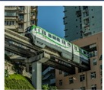
นั่งรถไฟทะลุติ๊ก