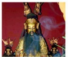
เอียงบู๊ซัว