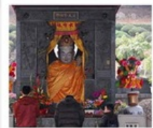
ไต้ฮ่องกง