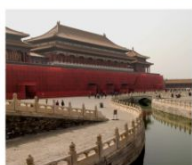
พระราชวังปักกิ่ง