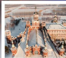
คฤหาสน์วอลคาร์