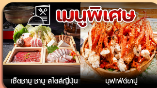
เรีตซาบู ซาบู สลัดสัปปู