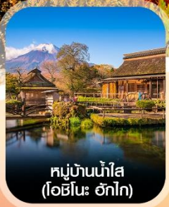
หมู่บ้านน้ำใส (โอชิโนะ ฮักไก)