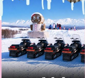
ลานสกีชิโกะโนะโอกะ