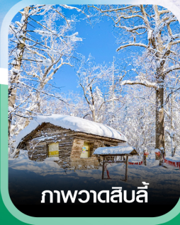
ภาพวาดสีบลู