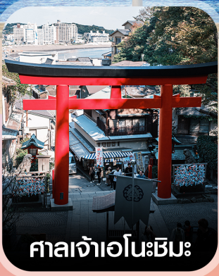
ศาลเจ้าเอโนะชิมะ