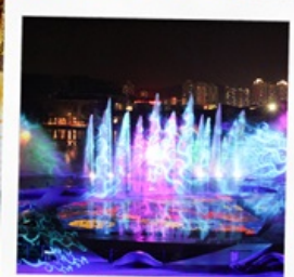
โชว์ม่านน้ำสามมิติ OCT BAY WATER SHOW