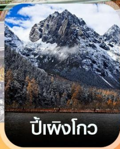
ปีเหมิงโกว

✈️ คอนเฟิร์มออกเดินทาง ทุกปีเรียด 2 ท่านขึ้นไป ✈️