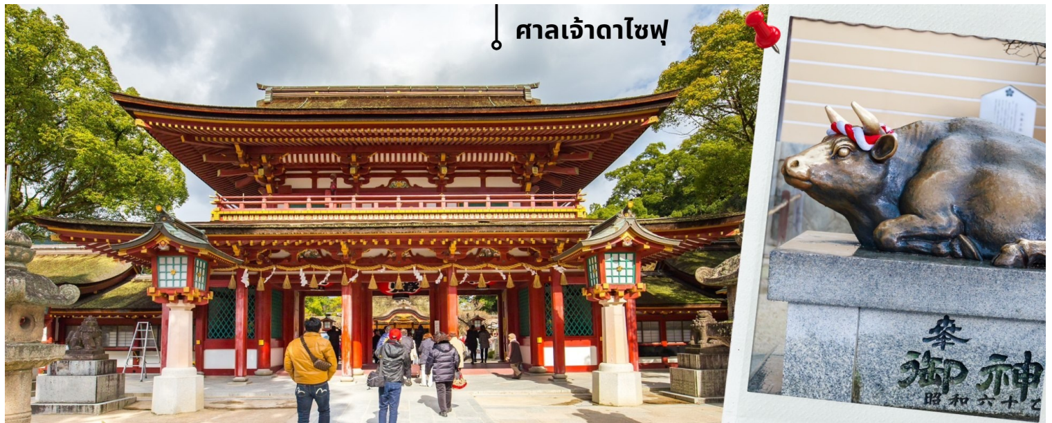
ศาลเจ้าดาไซฟุ

07.55 น. เดินทางถึงสนามบินนานาชาติฟุกุโอกะ ประเทศญี่ปุ่น หลังจากผ่านพิธีตรวจคนเข้าเมืองและศุลกากรแล้ว นำท่านขึ้นรถโค้ชปรับอากาศ จากนั้นเดินทางสู่ เมืองฟุกุโอกะ นำท่านเดินทางสักการะขอพรที่ ศาลเจ้าดาไซฟุ ศาลเจ้าแห่งนี้สร้างขึ้นสักการะเทพเท็นจิน เทพเจ้าแห่งการศึกษาของญี่ปุ่น อยู่ที่เมืองดาไซฟุ จังหวัดฟุกุโอกะ มีความสวยงามและประวัติศาสตร์ที่น่าสนใจ หนึ่งในไฮไลท์ที่ดึงดูดให้นักท่องเที่ยวมาที่นี่คือ สะพานไทโคบาชิ (Tai Ko Bridge) ที่มีลักษณะเป็นสะพานสีแดงสด เรียงต่อกัน 2 สะพาน โดยเป็นสัญลักษณ์ของ “อดีต - ปัจจุบัน - อนาคต” และอีกหนึ่งจุดที่คนนิยมมาถ่ายรูปกันก็คือ การมาลูบหัวรูปปั้นวัว ที่ศาลเจ้า นอกจากจะมีศาลเจ้าให้ไหว้สักการะแล้ว ยังมีสถาปัตยกรรมที่งดงาม และร้านอาหารอร่อยๆให้ได้ลองอีกด้วย