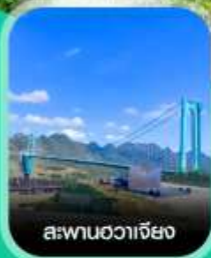
สะพานฮวาเจียง