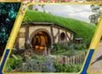
หมู่บ้านฮอบบิท