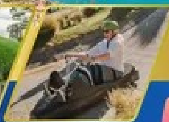
เล่นลู่ที่กรีนสทาวน์

AUCKLAND / ROTORUA / CHRISTCHURCH FOX GLACIER / FRANZ JOSEF / QUEENSTOWN พิกจ็อคแลนด์ 2 คืน / โรโตรัว 1 คืน / พิกโครสต์เชิร์ช 2 คืน พิกฟรานซ์โจเซฟ 1 คืน / คริสต์ทาวน์ 2 คืน