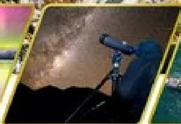
กิจกรรมชมทิวทัศน์ดาว