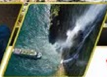
ล่องเรือมิลฟอร์ด ซาวน์