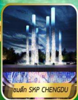
ชมตึก SKP CHENGDU