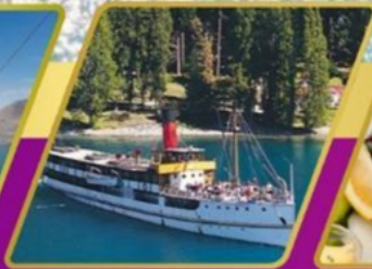
ล่องเรือกลไฟโบราณ อาหารแบบ BBQ ที่วอลเตอร์พ็อค ฟาร์ม