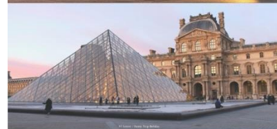
LOUVRE MUSEUM พิพิธภัณฑ์ลูฟวร์