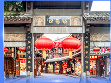
หมู่บ้านโบราณฉือซิว