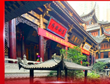
วอพรวัดหลัวฉิน ฉงชิ่ง