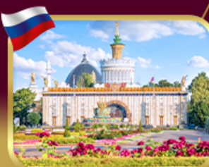
สวนสาธารณะ VDNKH