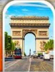
ARC DE TRIOMPHE FRANCE