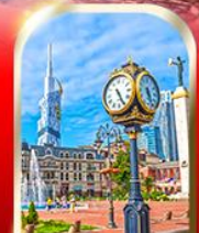
BATUMI CITY ADJARA

เมืองท้ำอุพลิสซิค ■ ป้อมอนาบูรี ■ นั่งกระเช้าชมเมืองบอร์โจนิ อนุสาวรีย์นิตรภาพ รัสเซีย-จอร์เจีย ■ โบสถ์เกอร์เกดี วิหารจวารี ■ มหาวิหารสวตีสคเวลี