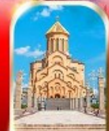
HOLY TRINITY CATHEDRAL