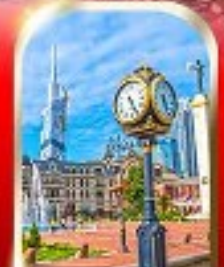
BATUMI CITY ADJARA

เมืองถ้ำอูปลิสซิค ■ ป้อมอนาบูรี ■ นั่งกระเช้าชมเมืองบอร์โจมี อนุสาวรีย์มิตรภาพ รัสเซีย-จอร์เจีย ■ โอสต์เกอร์เกดี วิหารจวารี ■ มหาวิทยาลัยสทิสโลวซี