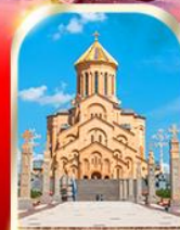
HOLY TRINITY CATHEDRAL