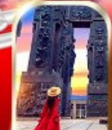
THE CHRONICLE OF GEORGIA