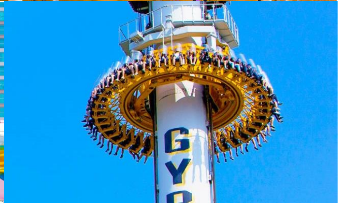
เที่ยง อีระอาหารกลางวัน ณ สวนสนุกล็อตเต้เวิลด์ (เพื่อให้ท่านได้สนุกอย่างเต็มที่)