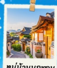
หมู่บ้านนูกซอน