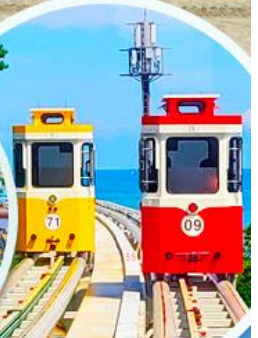
นั่งรถไฟปู๊กบีก

ราคานี้รวมค่าภาษีน้ำมัน + ค่าภาษีสนามบิน ** ปรับขึ้น ณ วันที่ 1 เม.ย. 69 เรียบร้อยแล้ว **