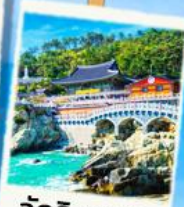
วัดริมทะเล