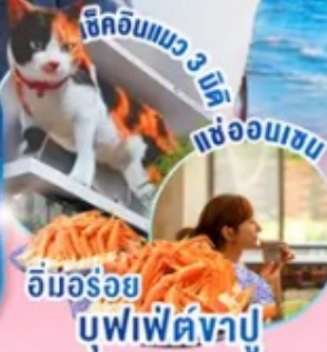
อิมอร้อย บุปไฟคังปู

ไฮไลท์!! สัมผัสความงามของดอกซากุระก่อนใคร ณ เมืองคาวาซึ ชมงานประดับไฟที่หมู่บ้านเยอรมัน 1 ใน 10 งานประดับไฟที่สวยงามที่สุดในญี่ปุ่น ขึ้นภูเขาไฟฟูจิชั้น 5 หรือ เล่นสกี ณ ฟูจิเท็นสกีรีสอร์ท (ขึ้นอยู่กับสภาพอากาศ) สักการะสิ่งศักดิ์สิทธิ์ ณ วัดอาซากุสะ พร้อมเดินชม ของอร่อยๆ ที่ ถนนนากามิเสะ