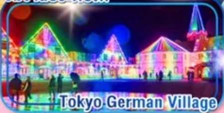
Tokyo German Village