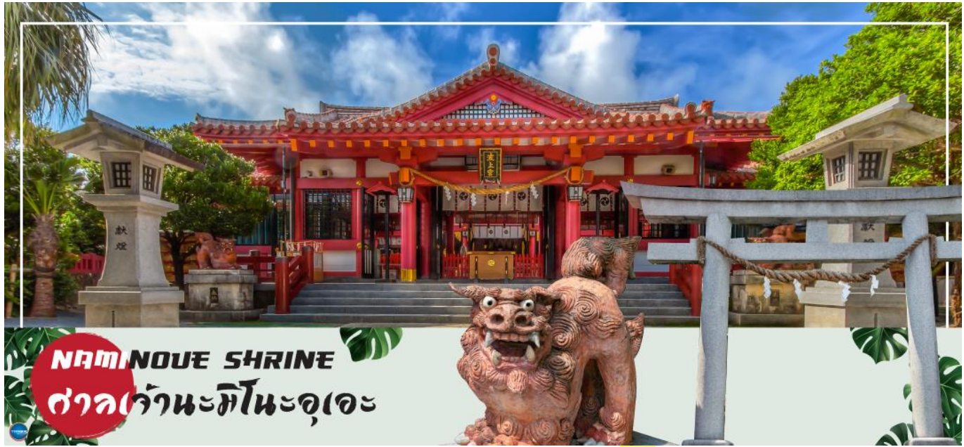
NAMINOUE SHRINE ศาลเจ้านะมิโนะอุเอะ

เช้า รับประทานอาหารเช้า ณ ห้องอาหารของโรงแรม (5) นำท่านเดินทางสู่ ศาลเจ้านะมิโนะอุเอะ (Naminoue Shrine) (ใช้เวลาเดินทางประมาณ 10 นาที) ตั้งอยู่ ณ บริเวณที่เป็นพื้นที่ศักดิ์สิทธิ์ที่ใช้ในการสวดภาวนาอธิษฐานต่อเทพเจ้าที่สถิตย์อยู่ ณ อาณาจักรเจ้าสมุทรโพ้นทะเลมาแต่ครั้งโบราณ ในอดีตชาวเรือที่เข้าออก ณ ท่าเรือนาสะ (Naha Port) ซึ่งขณะนั้นเป็นศูนย์กลางการแลกเปลี่ยนค้าขายกับนานาประเทศ ทั้งจีน ประเทศทางตอนใต้เกาหลี และชวายามาโตะ มักจะแหงนหน้ามองขึ้นไปยังศาลเจ้าซึ่งตั้งอยู่บนหน้าผาสูงเพื่ออธิษฐานและแสดงความขอบคุณ ศาลเจ้านะมิโนะอุเอะได้รับความเสียหายจากการรบในโอกินาวะ (Battle of Okinawa) เมื่อครั้งสงครามแปซิฟิก แต่ได้รับการบูรณะฟื้นฟูในเวลาต่อมาเมื่อสงครามสิ้นสุดลง ปัจจุบันนี้ได้กลายมาเป็นศูนย์กลางแห่งศาสนาชินโตในจังหวัดโอกินาวะ ชาวญี่ปุ่นมักจะมาไหว้ขอพรเกี่ยวกับธุรกิจการงานให้เจริญรุ่งเรือง ร่ำรวย และมาสะเดาะเคราะห์ให้พ้นโชคร้าย จากนั้นนำท่านสู่ เอาท์เล็ตมอลล์ อาชิบิโน่า (Okinawa Outlet Mall Ashibinaa) (ใช้เวลาเดินทางประมาณ 30 นาที) เอาท์เล็ตแห่งแรกในโอกินาวะ รวบรวมร้านค้าชั้นนำกว่า 100 ร้าน ทั้งเสื้อผ้าแฟชั่น สินค้าแบรนด์เนม นาฬิกา ข้าวของเครื่องใช้ ของเล่น ทุกร้านจัดเต็มทั้งสินค้านำเข้าและรุ่นใหม่ ลดราคากระหน่ำกว่า 30-80% ให้ได้เดินช้อปปิ้งท้ายทวีปกันอย่างจุใจ ภายใต้บรรยากาศสบายๆ สไตล์รีสอร์ทริมทะเล หากช้อปปิ้งเหนื่อยสามารถขึ้นไปทานอาหารที่ชั้น 2 มีอีกหลายร้านที่คอยให้บริการ