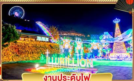
งานประดับไฟ Sagamiko Illumination