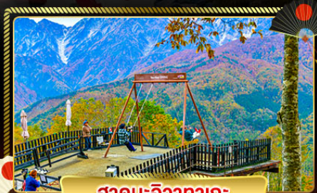
ฮาคุบะอิซากาตะ