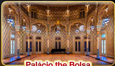
Palácio the Bolsa

📅 เดินทาง : 9 - 18 ต.ค. | 30 พ.ย. - 9 ธ.ค. 69