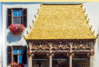
หลังคาทองคำอินน์สบูร์ค