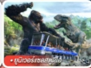
ยูนิเวอร์สอลสตูดิโอ