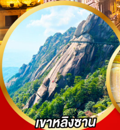
เวาหลิงซาน