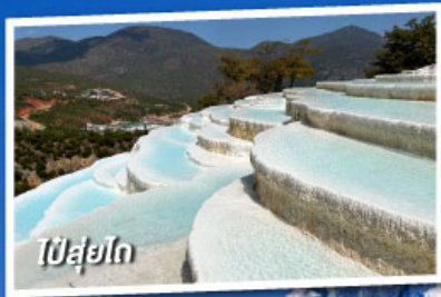
ปี๋สุ่ยโต

เที่ยวครบทุกไฮไลต์ • ไม่ลงร้านช้อปปิ้ง • พักโรงแรม 4 ดาว