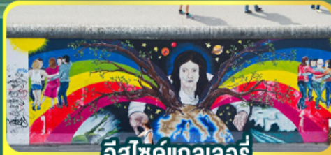
อิสซิด์เกลเลอร์