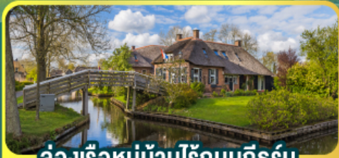
ล่องเรือหมู่บ้านโรกนทึร์น