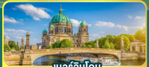
เบอร์ลินโดม